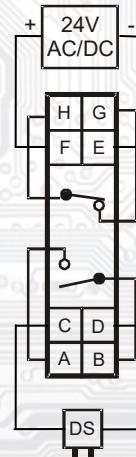
Kontakty relé při vypnutém napájení

H,G.....kontakty Re1 F..... svorka napájení +24VDC/24VAC E..... svorka napájení -24VDC/24VAC C,D.....svorky pro připojení sondy A,B.....kontakty Re2